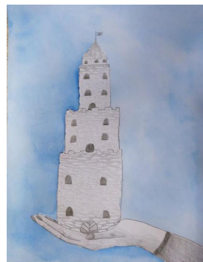
Výtvarné práce odeslané do soutěže Jindřichohradecký "Textík"