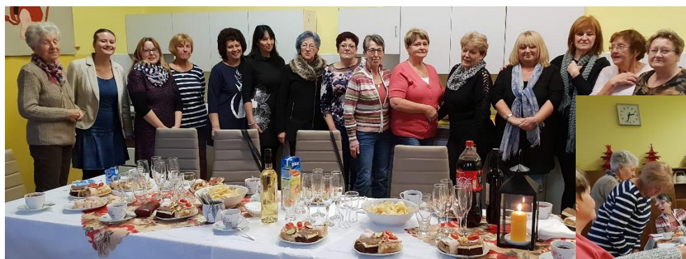
Setkání s učiteli důchodci