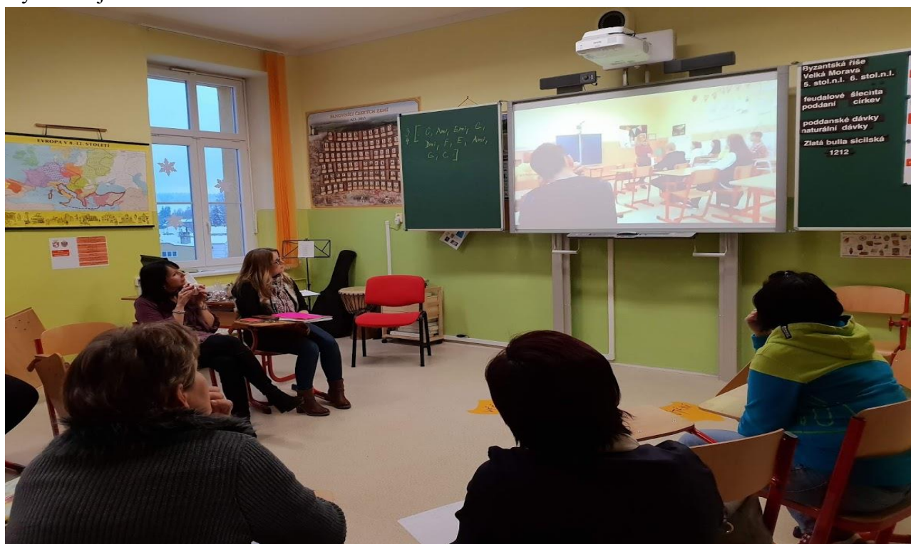
Schůzka formativní skupiny Ústeckého kraje