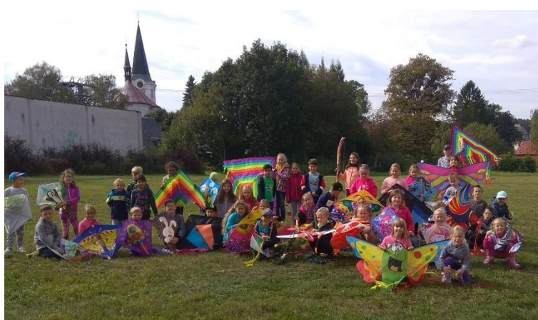
Drakiáda ve školní družině, 1. a 2. oddělení