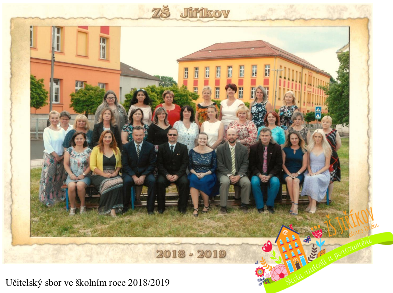
Učitelský sbor ve školním roce 2018/2019