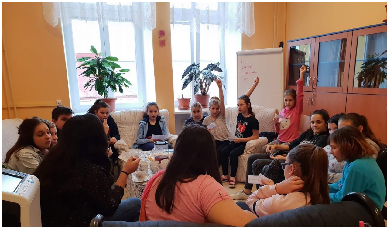
Výcvik nejmladších mediátorů

Naše škola je leadrem formativní skupiny Ústeckého kraje, v níž jsou zapojeny vyjma naší školy ZŠ Krásná Lípa a ZŠ Dolní Podluží. Společně nastudováváme strategie formativního hodnocení, natáčíme výuková videa, vyměňujeme si zkušenosti, které tlumočíme kolegyním a kolegům z dalších zapojených škol. V rámci odborného poradenství s námi spolupracují zkušení lektori a lektorky z Pedagogické fakulty Univerzity Karlovy.