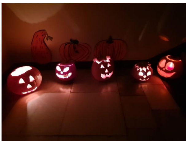
Strašidelná škola, 1. 11. 2019