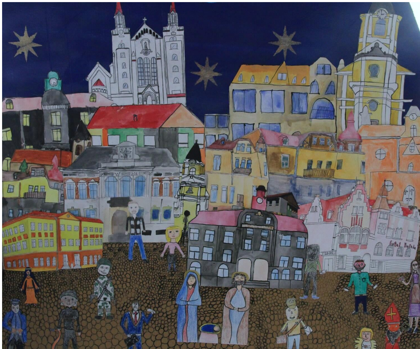
Jiříkovský betlém, společná práce žáků 2. stupně

Celkově Základní škola Jiříkov, příspěvková organizace Města Jiříkova hospodařila v čerpání nákladů v rozpočtu za období 1. – 12. /2018 na 98,39%, což vykazuje úsporu 1,61% . Ke dni 31. 12. 2018 příspěvková organizace hospodaří s výsledkem – ziskem v hlavní činnosti 226.699,68Kč a v hospodářské činnosti činil zisk 15.267,52Kč .