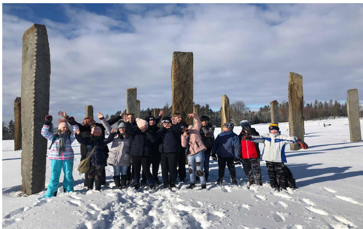
Zimní den 7. B