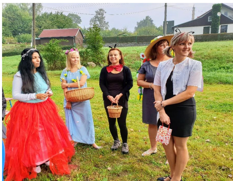
Pohádkové zahájení školního roku 2018/2019