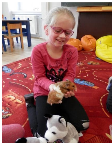
Zvířátkový den ve školní družině